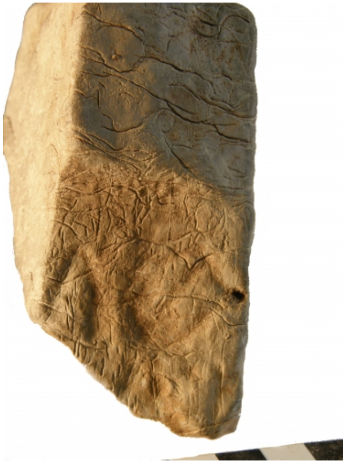
Créditos: Ignacio Simón Cornago