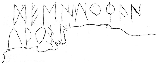
Créditos: In situ_Dibujo: Luján - López Fernández 2015, fig. 5