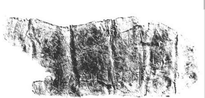
Créditos: Guérin - Silgo 1996