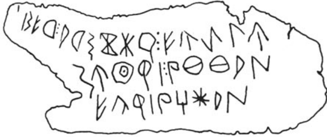
Créditos: Guérin - Silgo 1996