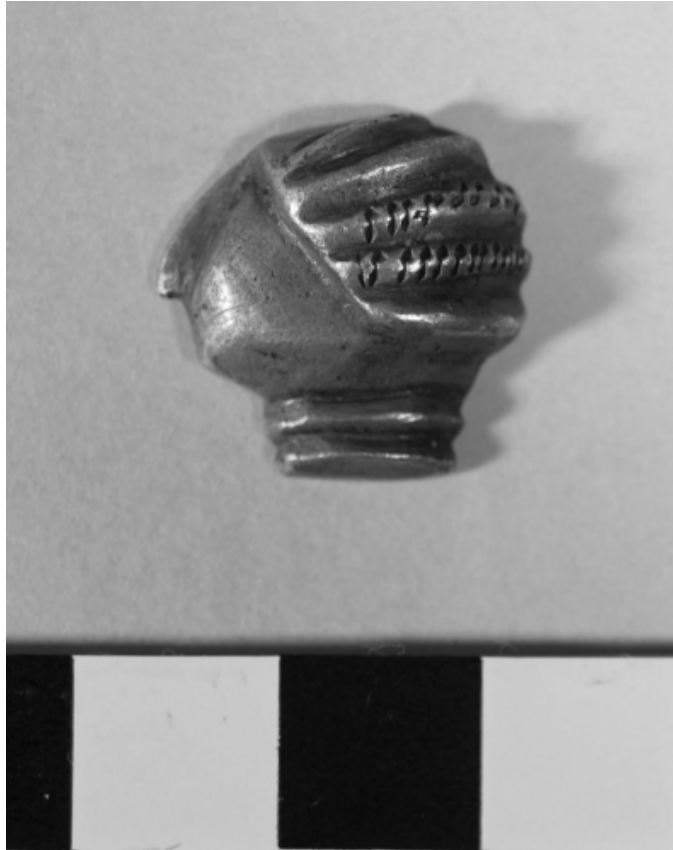
Créditos: Foto: F. Beltrán Lloris / Real Academia de la Historia