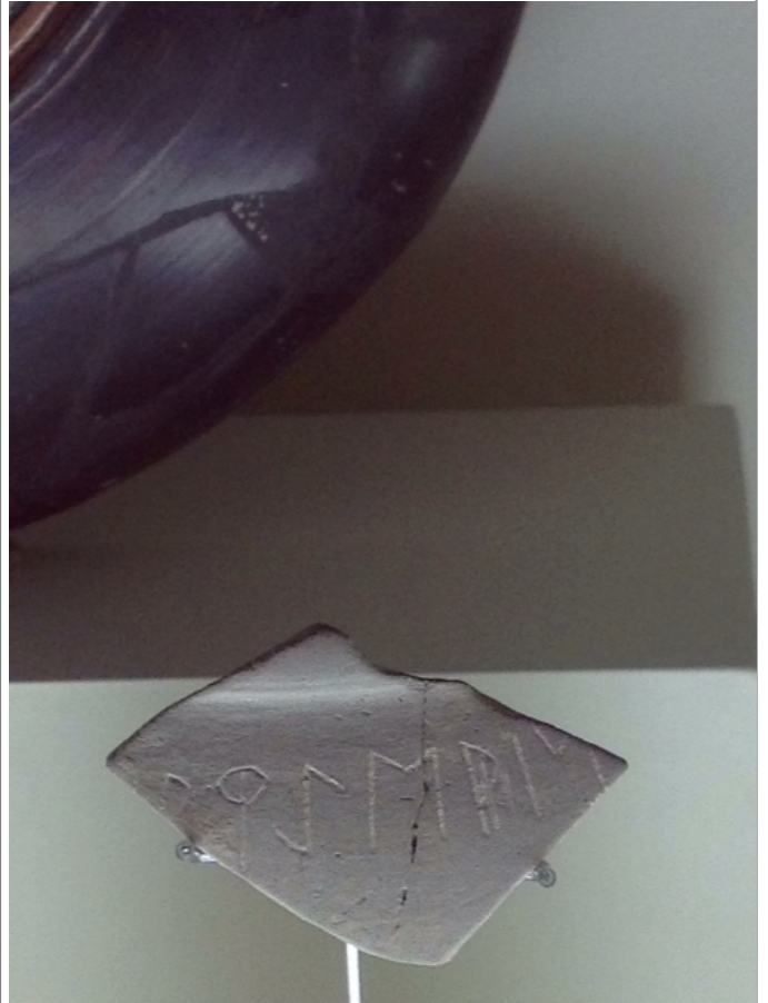
Créditos: V. Sabaté