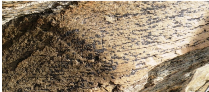
Créditos: PC-JFJ, Palaeohispanica 10