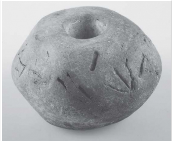
Créditos: Foto: De Bernardo et alii 2011, 414.