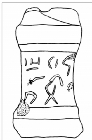
FIGURA 167a. Dibuix del petit altar MNAT 338 amb el calc del text ibèric A (núm. 48,A).