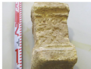
FIGURA 168a. Fotografía del petit altar MNAT 338 amb el text ibèric A (núm. 48,A).