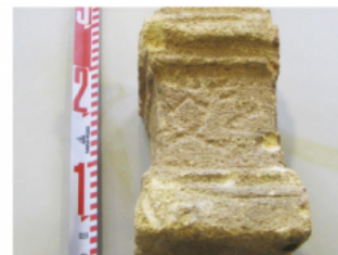
FIGURA 168b. Fotografía del petit altar MNAT 338 amb el text ibèric B (núm. 48,B).