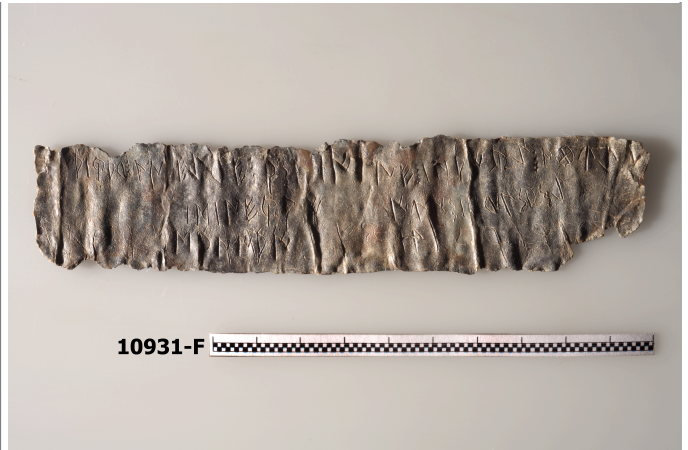
Créditos: J. Principal