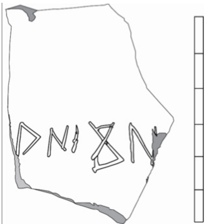
Créditos: Dibujo: Estarán et alii 2011, 260.