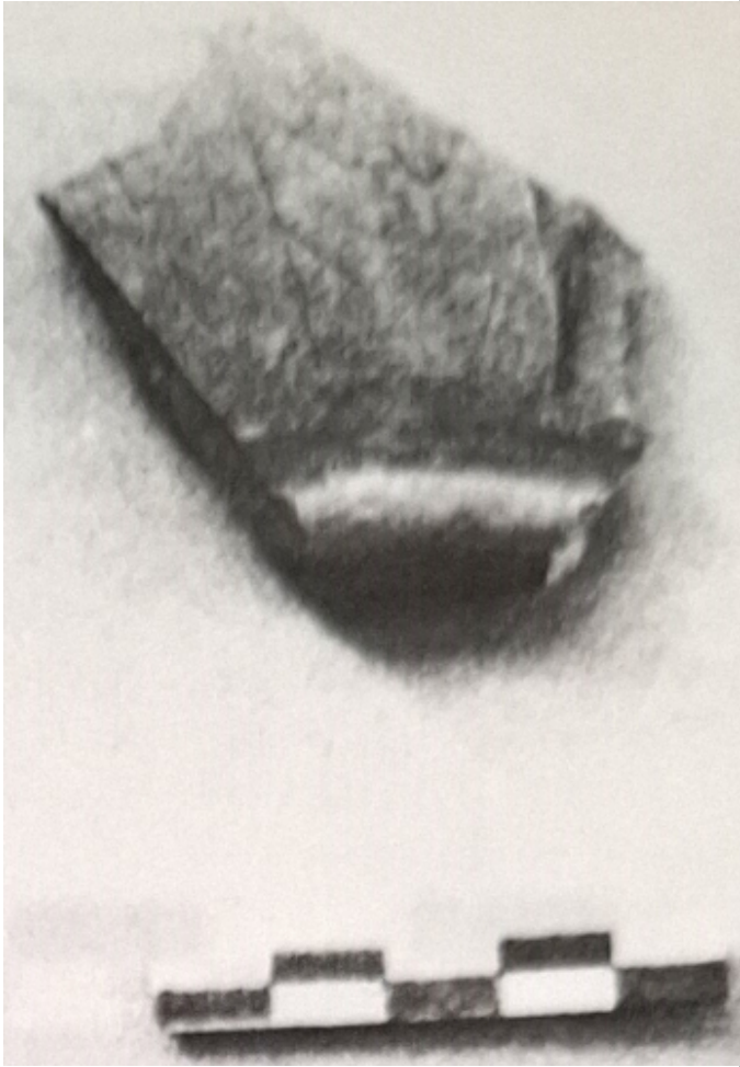
Créditos: N. Molist