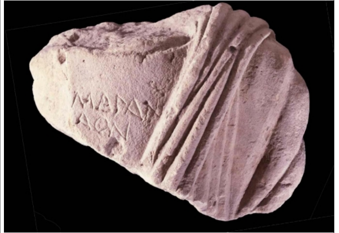
Créditos: MAN Foto: Ceres