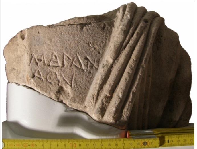
Créditos: Ignacio Simón Cornago