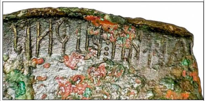
Créditos: "Hesp." Hispania Antiqua. Revista de Historia Antigua, XLIII, p. 11