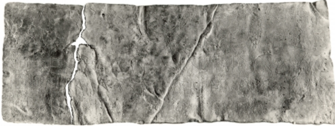
Créditos: Gómez-Moreno, 1962