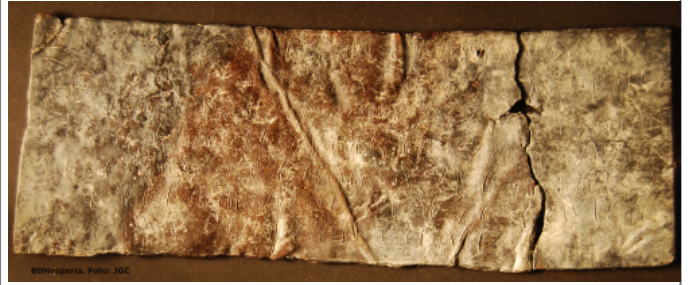
Créditos: BDHesperia_JGC. Museu Arqueològic Municipal Camilo Visiedo. Alcoy