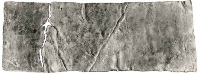
Créditos: Gómez-Moreno, 1962