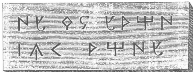
Créditos: Erro 1806