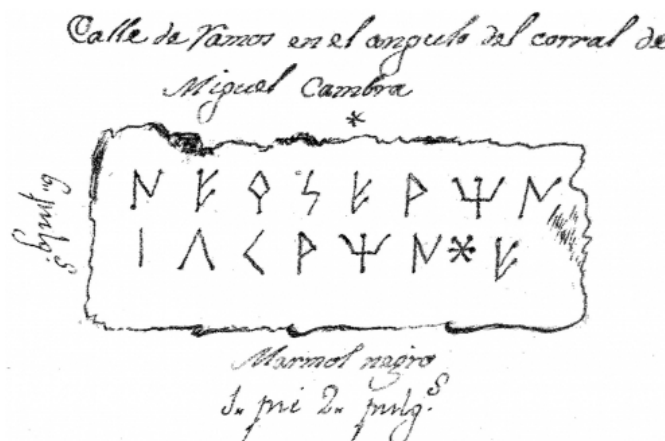
Créditos: Almagro-Gorbea 2003