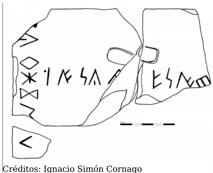
Créditos: Ignacio Simón Cornago