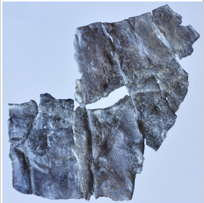
Créditos: Foto: Museu de Prehistòria de València_Depósito: Museu de Prehistòria de València