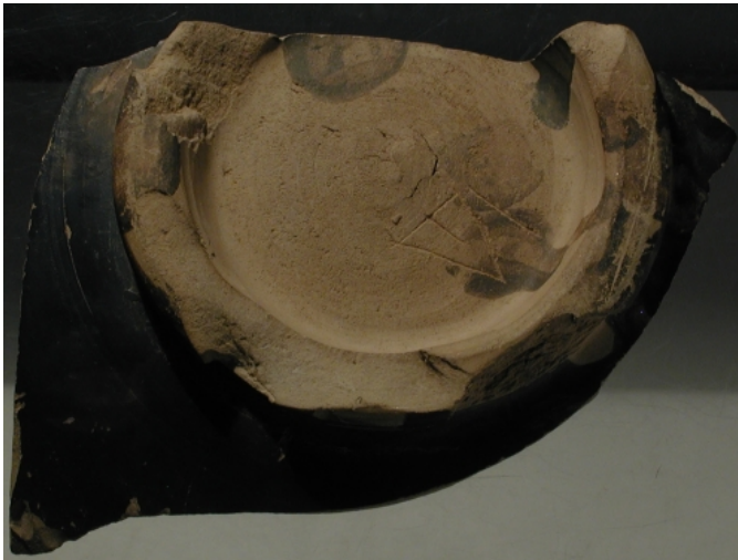
Créditos: Foto: Museu de Prehistòria de València_Depósito: Museu de Prehistòria de València