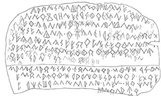
Créditos: Fletcher 1980