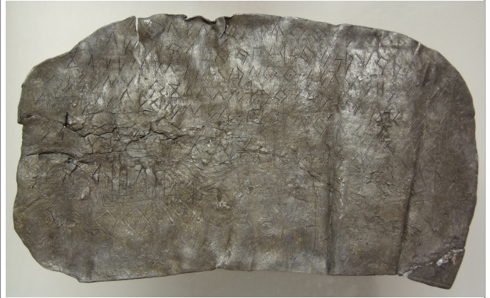
Créditos: Foto: Museu de Prehistòria de València_Depósito: Museu de Prehistòria de València