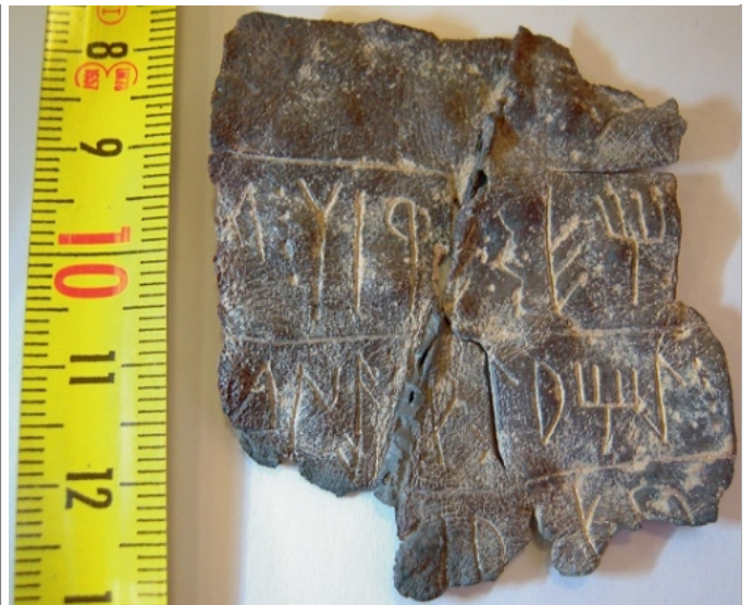
Créditos: Ferrer i Jane 2013