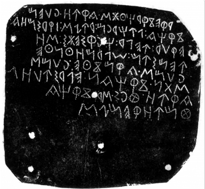
Créditos: Real Academia de la Historia-A. Fernández-Guerra