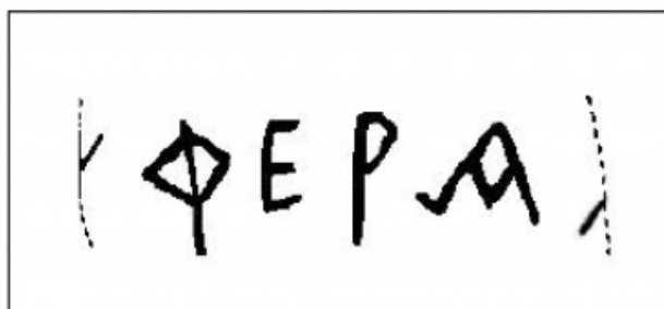
FIGURA 40. Calc de la inscripció de la Llosa (núm. 9).