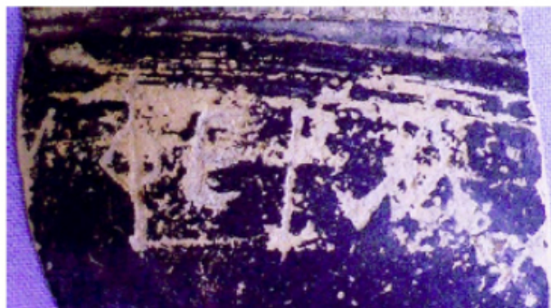
FIGURA 39. Fotografía de la inscripció ibèrica de la Llosa (núm. 9).