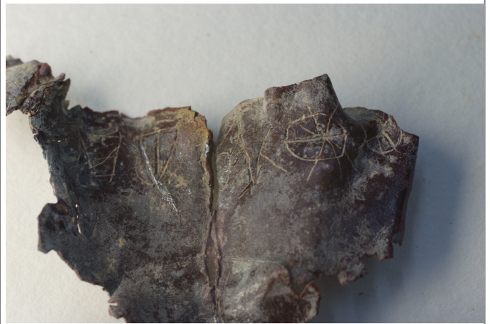
Créditos: Burriel et al 2011