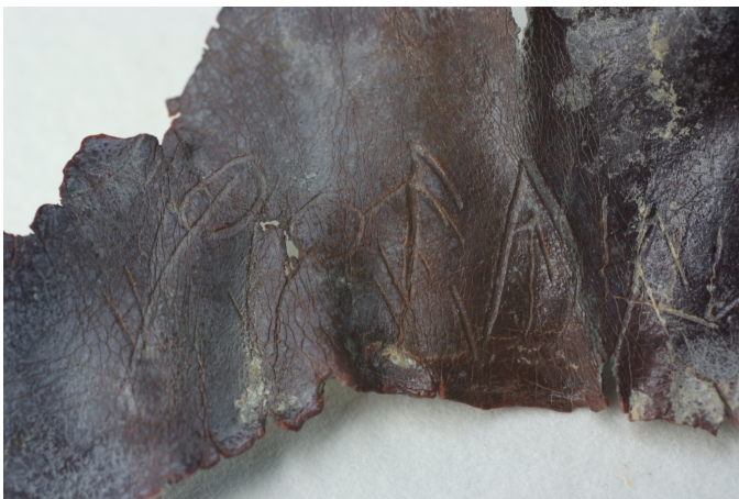
Créditos: Burriel et al 2011