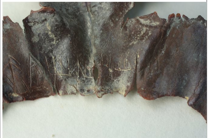
Créditos: Burriel et al 2011