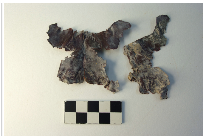
Créditos: Burriel et al 2011