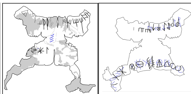
Créditos: Ferrer i Jané 2014