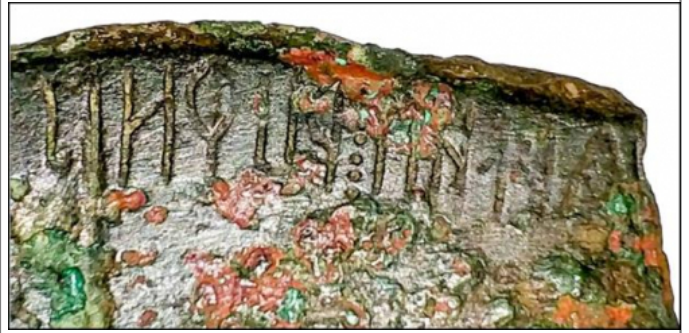
Créditos: "Hesp." Hispania Antiqua. Revista de Historia Antigua, XLIII, p. 11