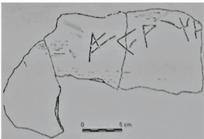
Créditos: J.F. Clariana