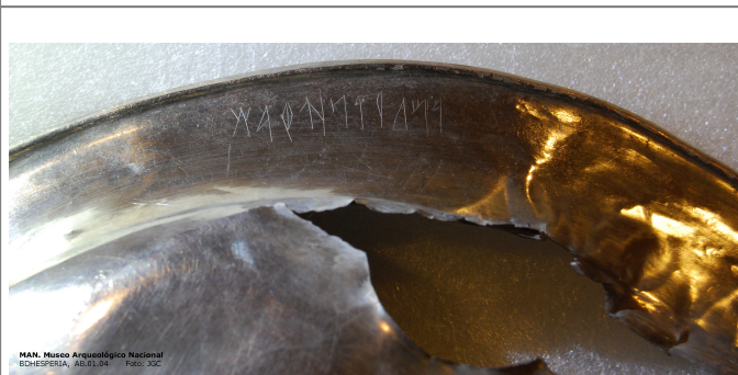
Créditos: BDHesperia JGC