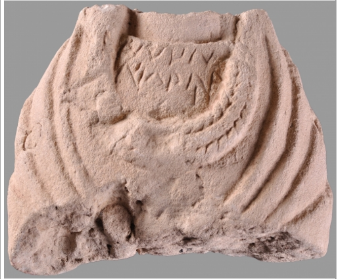
Créditos: Fotografía Museo de Albacete (N.º Inv. 12)