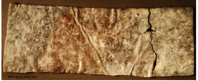
Créditos: BDHesperia_JGC. Museu Arqueològic Municipal Camilo Visiedo. Alcoy