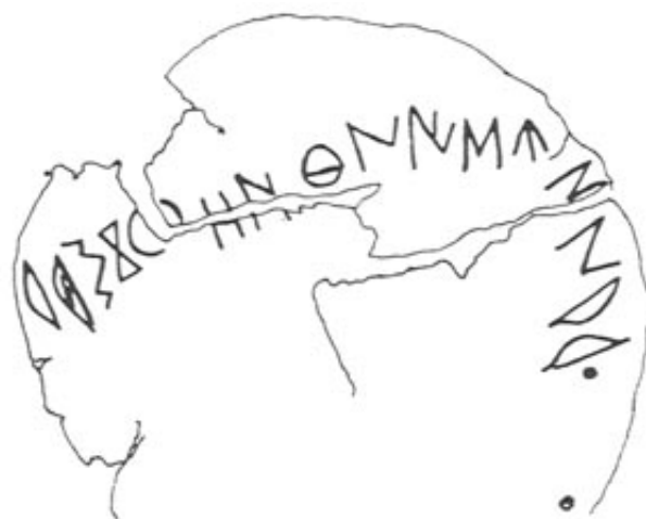
Créditos: Fletcher 1983b