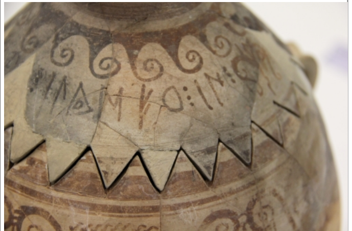
Créditos: Museu de Prehistòria de València. Foto: ALF (junio2014)