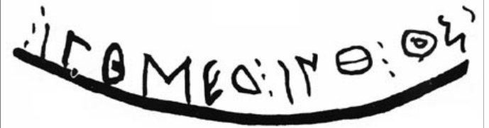
Créditos: Fletcher 1985, fig. 6, XXI