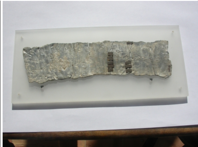
Créditos: J. Velaza