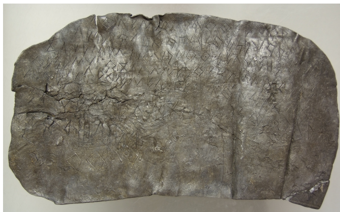
Créditos: Foto: Museu de Prehistòria de València_Depósito: Museu de Prehistòria de València