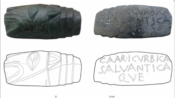
Créditos: Fotos: M. Á. Ríos Pérez. Dibujo: M a C. Sopena, apud Beltrán et alii 2020, 160.