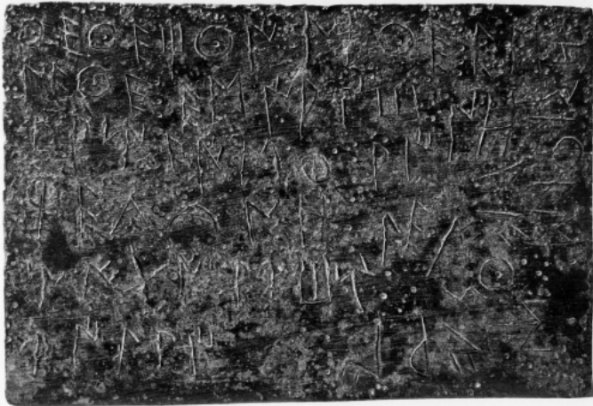
Créditos: Francisco Burillo