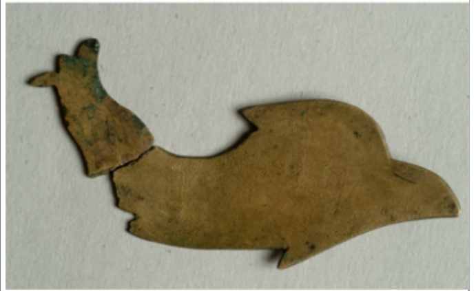
Créditos: David Stifter