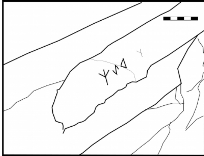
Créditos: PC-JFJ, Palaeohispanica 10