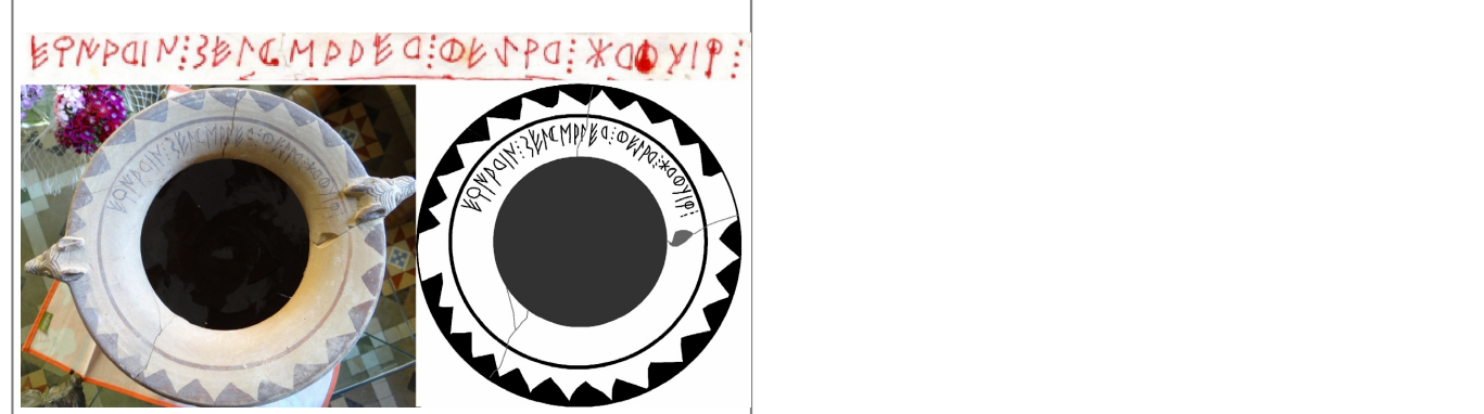
Créditos: Ferrer i Jané - Escrivà 2013, fig. 2