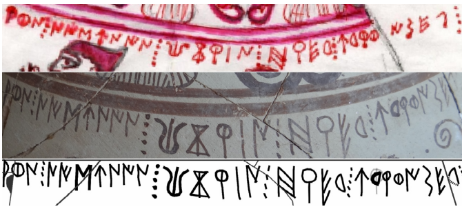
Créditos: Ferrer i Jané - Escrivà 2013, fig. 2