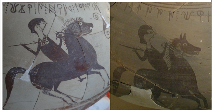
Créditos: Ferrer i Jané - Escrivà 2013, fig. 2