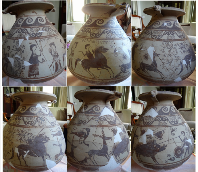
Créditos: Ferrer i Jané - Escrivà 2013, fig. 2