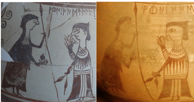
Créditos: Ferrer i Jané - Escrivà 2013, fig. 2