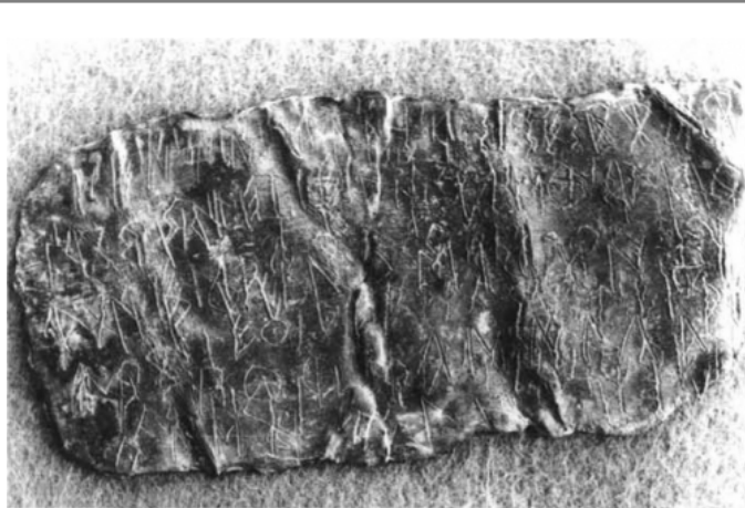
Créditos: Untermann 1998a, fig. 7 cara A