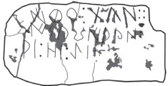
Créditos: Ferrer i Jané - Escrivà 2014