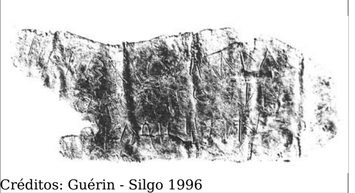
Créditos: Guérin - Silgo 1996