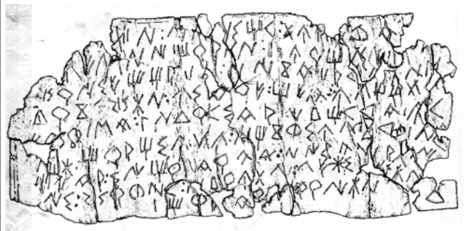
Créditos: E. Sanmartí